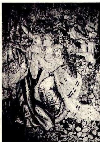
Tapisserie flamande XVI e siècle. Le Massacre des Saints Innocents.

Parmi les événements marquants de sa période madrilène, deux sont particulièrement intéressants à signaler pour avoir eu des répercussions à Agen : le 3 septembre 1877, il organise à Agen, dans son hôtel de la rue Montesquieu (qui porte toujours son nom), une entrevue entre son Ministre des Affaires Etrangères Decazes et le Premier Ministre espagnol Canovas pour la signature d'un traité commercial. Plus tard, à Madrid, ayant donné une grande fête en l'honneur du mariage du roi il se voit offrir en remerciement, un magnifique tableau de l'école de Raphaël : la Vierge, Jésus et Saint-Jean Baptiste , qui se trouve aujourd'hui au Musée d'Agen.