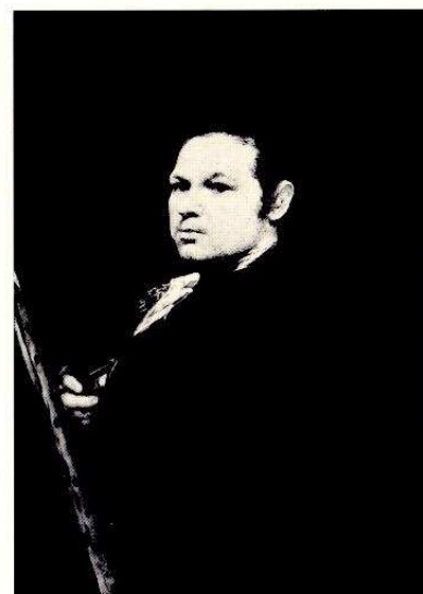
Francisco Goya (1748-1828). Autoportrait.