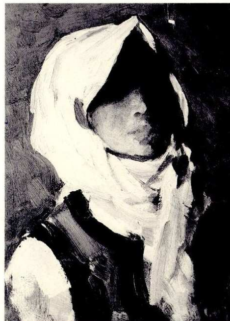
Nicolae Grigoresco (1838-1907). Tête de paysanne roumaine.