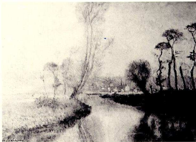
Albert Lebourg (1849-1928). La vallée de la Veulette.